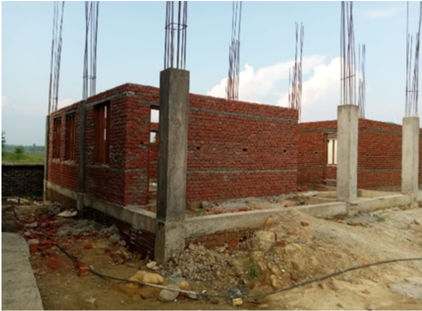
कामता मा वी

१०२.२ निर्माण योजना तयारी- सार्वजनिक खरिद नियमावली २०६४ को नियम १० अनुसार सार्वजनिक निकायले बार्षिक रुपमा १० लाख भन्दा बढीको खरिद कार्य गर्न वार्षिक खरिद योजना तयार गरी खरिद योजना अनुसार खरिद कार्य गर्नुपर्नेमा सो नगरी वजेट निकासता तथा रकम अनुसारको लागत अनुमान तयार गरी खरिद कार्य गर्ने गरेको देखिएको पालिकाले आगामी दिनमा निर्माण कार्य समयमै पुरा हुने गरी खरिद योजना तयार गरी खरिद कार्य गर्नुपर्दछ।