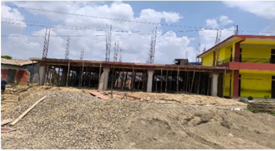
बाल मा वी