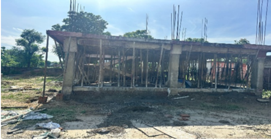
शान्ति आ वि डुगवा